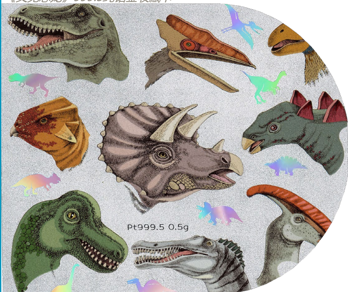
《又见恐龙》999.5纯铂金收藏卡