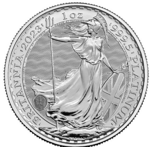
2023年不列颠尼亚女神1盎司铂金币背面

“不列颠尼亚女神是我们最具标志性和经久不衰的设计之一。因此，我们在保留硬币美感的同时增加了复杂的新防伪措施，这一点至关重要。通过专注金属的自然反射及使用一项先进新技术，我们创造了一种独一无二而高度安全的硬币，保障了客户信心。”